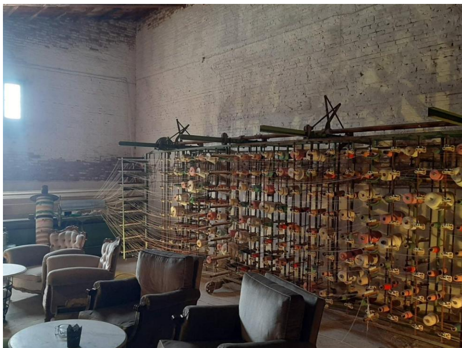
Το «κλουβί»: το μηχάνημα που τύλιγε τις χρωματιστές κλωστές σε κουβάρια...