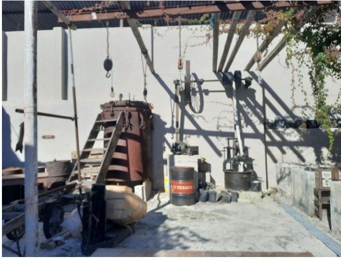
Ο χώρος του βαφείου...